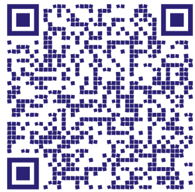
RETIROS DE FRENTE

PLANCHETA CATASTRAL: Al no estar inscripto en catastro, el loteo no cuenta con plancheta catastral.