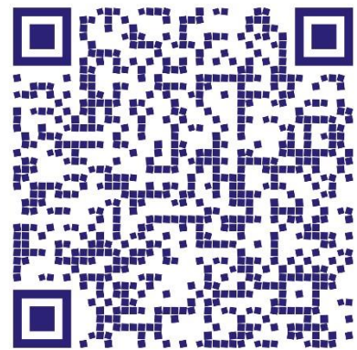
RETIROS DE FRENTE

PLANCHETA CATASTRAL: Al no estar inscripto en catastro, el loteo no cuenta con plancheta catastral.