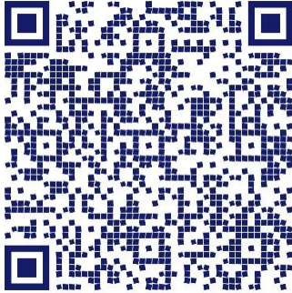
DECLARACION JURADA LEGAJO DE OBRA FIRMADA POR PROPIETARIO

Para completar los Formularios de Categorización de Vivienda, seleccionar en cada ítem el bloque descriptivo que corresponda de acuerdo con el proyecto. Estos formularios serán las bases para los impuestos inmobiliarios, Municipales y Provinciales del lote cuando este en las últimas instancias de aprobación de loteo. Ej. a continuación: