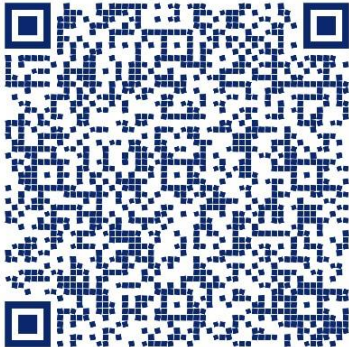
FORMULARIO CATEGORIZACION MUNICIPAL