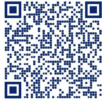
FORMULARIO CATEGORIZACION PROVINCIAL (2)

IV. SOLICITAR CONEXIÓN ELÉCTRICA: el propietario que decida comenzar obra deberá solicitar su conexión en EPEC. El pilar deberá estar ejecutado sobre la línea municipal, siendo elección del propietario la distancia a la medianera. Para conocer los requisitos para solicitar el servicio, visitar la página web del ente: www.epec.com.ar .