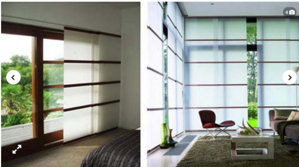
Los paneles japoneses aportan gran cantidad de beneficios en la decoración del hogar. (Grupo Edisur)

Si necesitás separar un espacio de otro, o simplemente querés crear una habitación relajada al estilo oriental, los paneles japoneses son la mejor opción. Grupo Edisur te cuenta más acerca de esta tendencia que comienza a instalarse en la decoración.