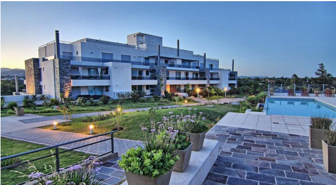
El caso de Casonas del Golf

Nórdicos. Tendencia global. Acá se necesita mucho blanco y para romper la monocromía, se lo puede combinar con grises, colores tierras, azules o pasteles. ¿Qué se gana? Luminosidad y sensación de amplitud. Este estilo rehúye de los accesorios que recargan así que cada pieza debe tener una función, como sillas, puf, espejos. ¿Lo imprescindible? La madera en el mobiliario, en tonos claros y naturales.